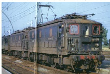
V2A 1950 (BB 353*)