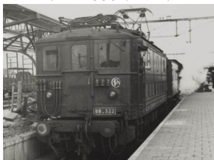
V1A 1950 (BB 322*)