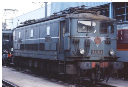
V2B 1965 GRG (BB 354*)