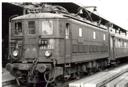
V1B 1965 (BB 324*)